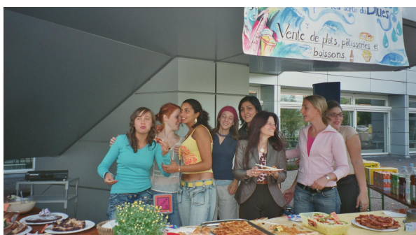
Elèves du collège genevois et leur professeure