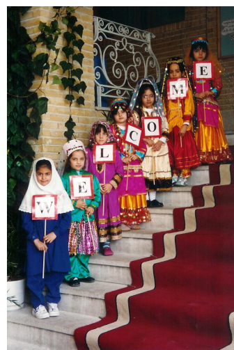
Ecole primaire de Téhéran

Des stands vous attendent, avec notamment des produits iraniens. Merci de leur faire bon accueil: les bénéfices de cette soirée serviront à aider le financement de ce projet.